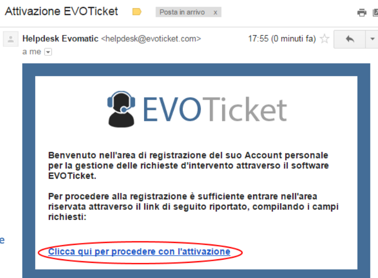
Figura 1 - Mail con richiesta di attivazione

E' sufficiente premere sul link evidenziato per accedere automaticamente alla pagina web di attivazione, le poche informazioni che chiediamo servono esclusivamente per semplificare il processo di assistenza, i campi marcati con l'asterisco sono obbligatori ma consigliamo di compilarli tutti in modo da fornirci i riferimenti necessari per garantire un servizio rapido ed efficiente.