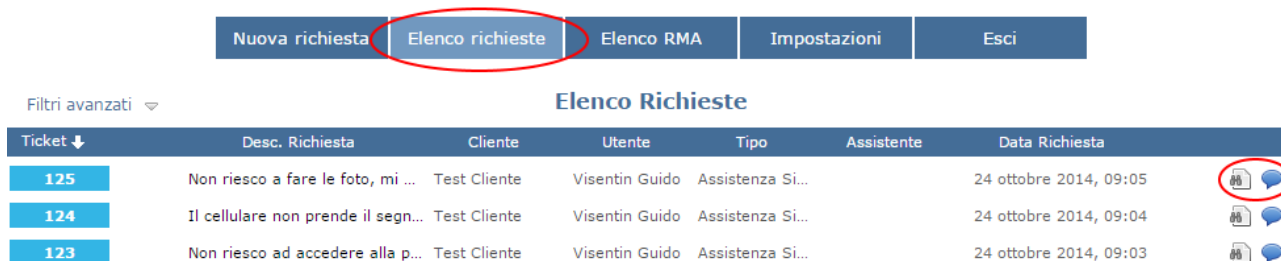
Figura 5 - Elenco richieste

Dall'elenco delle richieste (Figura 5) possiamo vedere lo storico delle richieste di assistenza, il pulsante dettagli permette di vedere lo stato di avanzamento della richiesta, mentre il pulsante Chat permette di comunicare direttamente con l'assistenza tecnica (Figura 6).